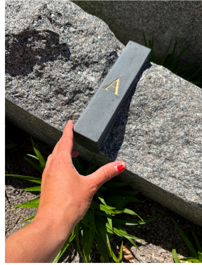
Platåbergen i Falbygdens bergarter i ordningsföljd: USA KL 3 Urberg, Sandsten, Alunskiffer, Kalksten, Lerskiffer och 3/Diabas.