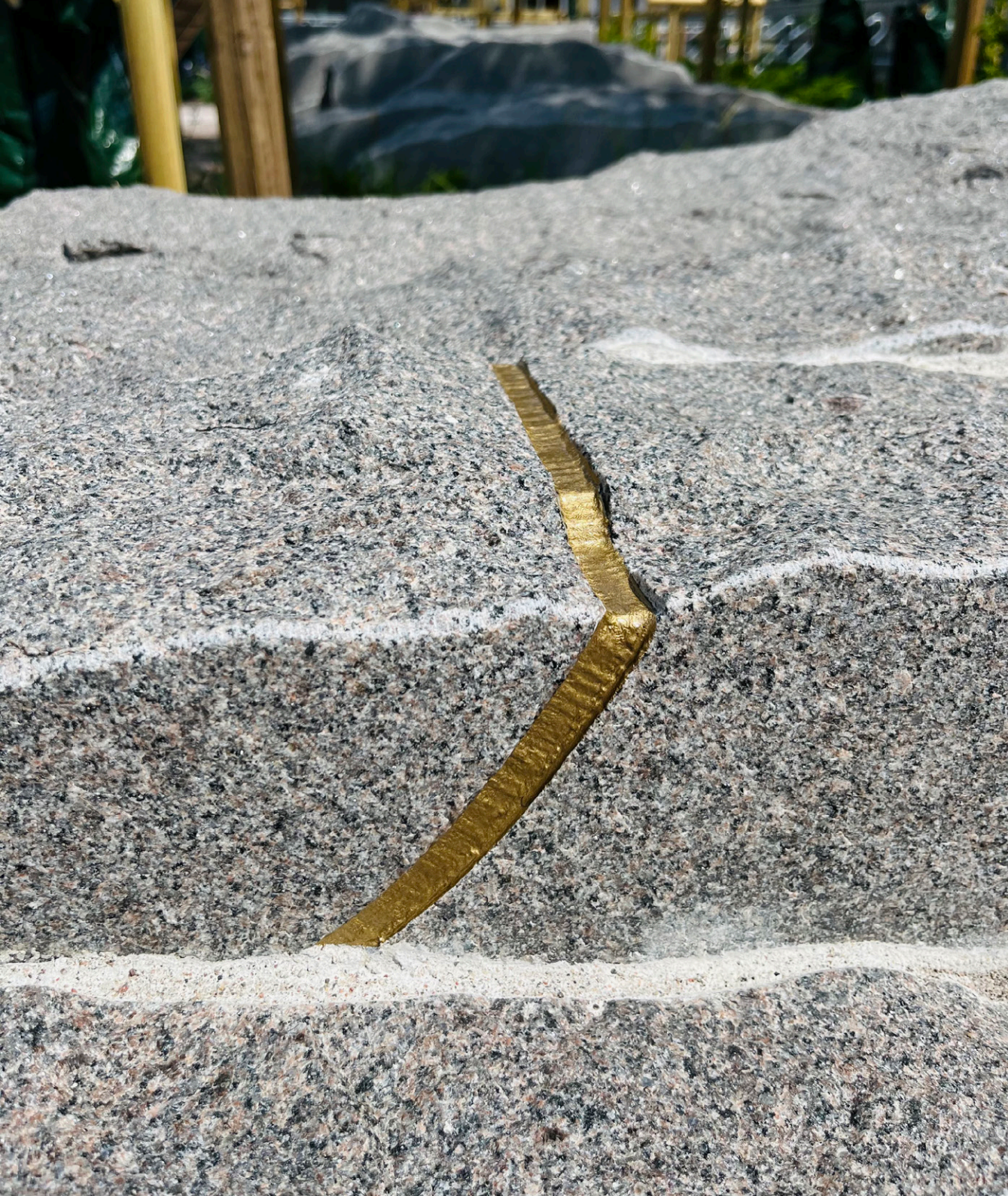
Detaljbild av linjen.